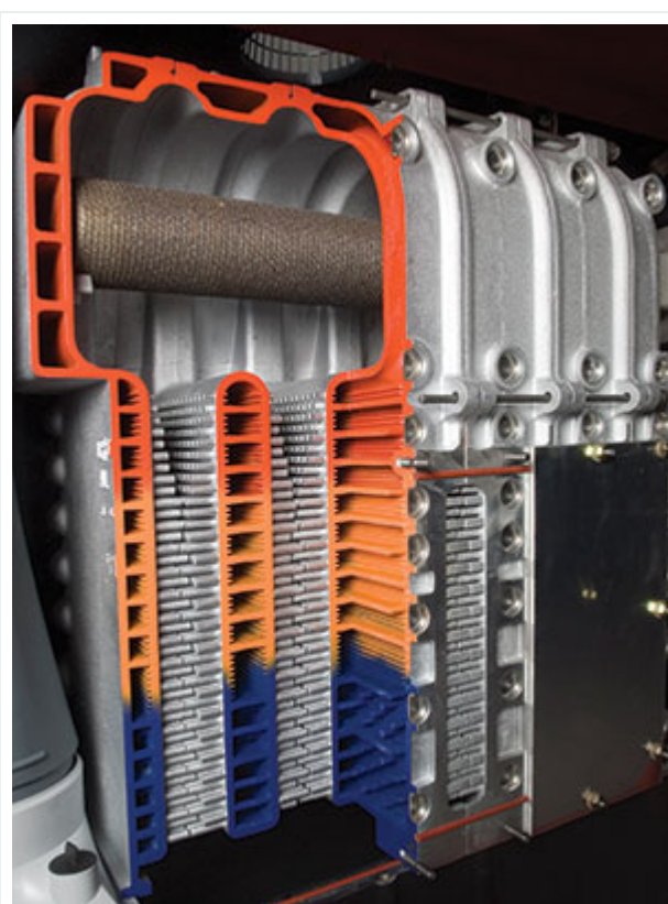
3 | Warmtewisselaar van een stookketel

Indien men een nieuwe stookketel aansluit op een bestaande installatie waarvan het water niet aan deze eisen voldoet, dient men niet alleen de afzettingen te verwijderen (zie kader ), maar ook de mogelijke toevoer van zuurstof in het circuit tot een minimum te beperken (zie kader 'Vermijden van slibvorming' ).