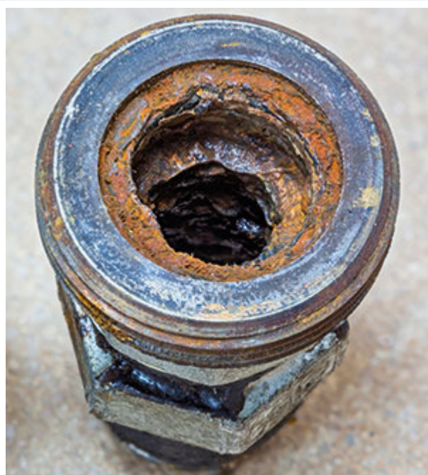
4 | Afzettingen van ijzeroxides in de leidingen

Indien de installatie zodanig opgebouwd is dat de toevoer van zuurstof en/of van corrosiebronnen niet uitgesloten kan worden, dient men te opteren voor een geschikte continue waterbehandeling die afgestemd moet worden op de in het water aanwezige materialen (1 tot 10 liter product per 1000 liter te behandelen water). De effecten van deze behandeling op de waterkwaliteit moeten op regelmatige basis gecontroleerd worden. Indien er water aan de installatie toegevoegd wordt, willen we erop wijzen dat ook dit vulwater behandeld moet worden.