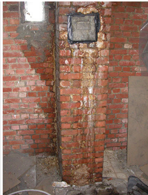
1 en 2 | Verschijning van vochtplekken op de binnenafwerking en aan de omtrek van het rookgasafvoerkanaal

De hoeveelheid condensatie die gevormd kan worden in een rookgasafvoerkanaal, is onder meer afhankelijk van het debiet van de rookgassen, de temperatuur ervan aan de uitgang van de stookketel en de afkoeling in het rookgasafvoerkanaal. Deze laatste parameter is mede afhankelijk van de sectie en de thermische isolatie van het rookgasafvoerkanaal (een overdimensionering van de sectie en een gebrek aan thermische isolatie leiden tot een grotere daling van de rookgastemperatuur), van de temperatuur in de ruimten die grenzen aan het rookgasafvoerkanaal (buitenomgeving, al dan niet verwarmde ruimte ...), van het tracé en de lengte van het rookgasafvoerkanaal en van de hoeveelheid waterdamp die ontstaat bij de verbranding (afhankelijk van de brandstof).